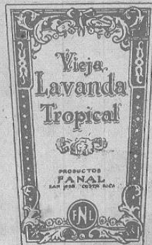
Esencia purísima de flores de Lavanda