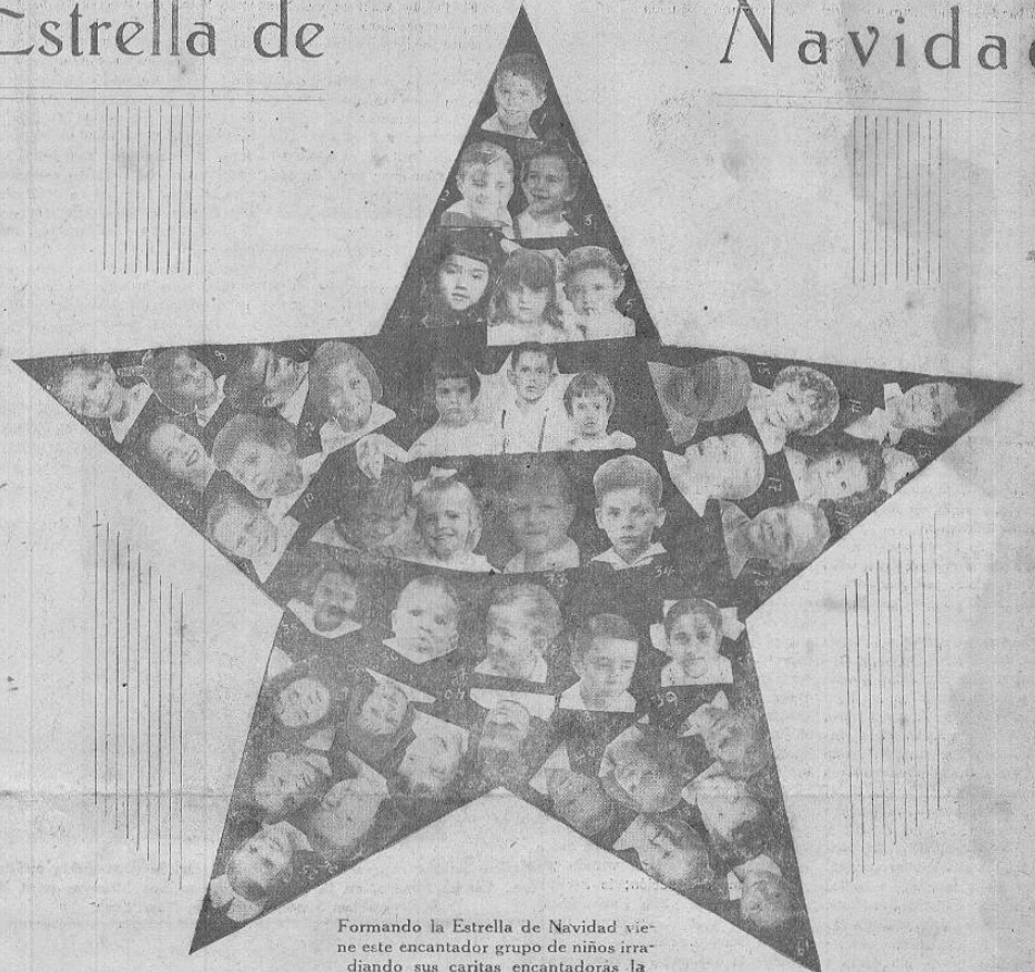
Formando la Estrella de Navidad viene este encantador grupo de niños irradiando sus caritas encantadoras la ilusión, la esperanza y la paz. Son ellos: