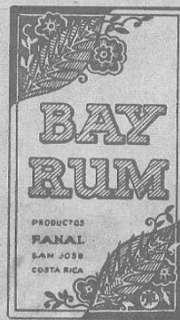
Aceite esencial de "bay" y Ron garantizado de 16 años de edad