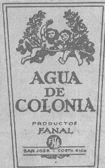
Discreta y de aroma 'realmente' Distinto