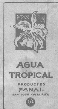
El aromoso Trópico aprimonado con sin igual maestría